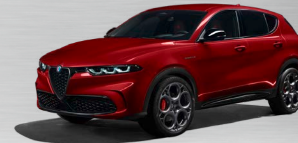
414 Rosso Alfa