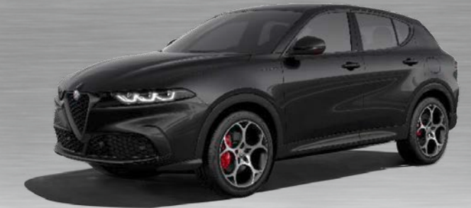
601 Nero Alfa