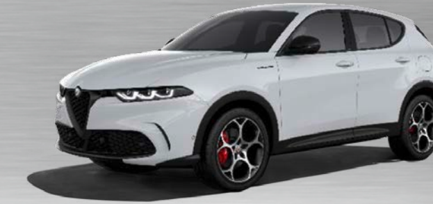
217 Bianco Alfa