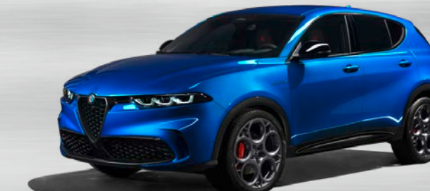
756 Blu Misano