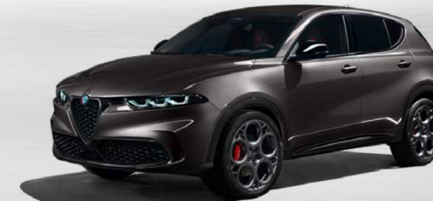
581 Grigio Vesuvio