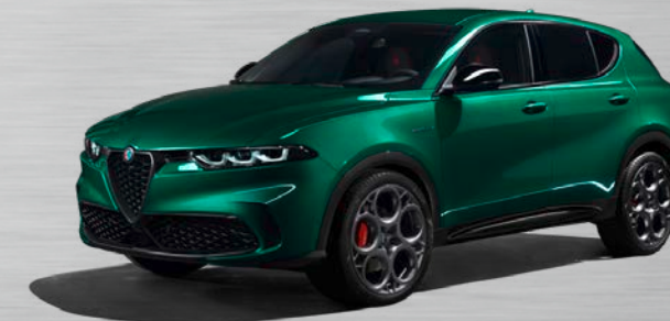
398 Verde Montreal

Die gezeigten Farben können aus drucktechnischen Gründen von den Originalfarben abweichen. Bilder zeigen Sonderausstattung.